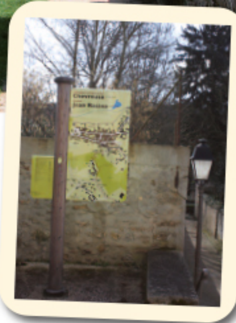
Promenade historique de Chevreuse panneau de départ, situé place de la Mairie

(Extraits plaquette Promenade historique, disponible à l'Office de tourisme).