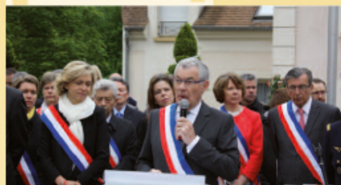
8 MAI • Commémoration du 70 e anniversaire de la victoire de 1945 (voir reportage p. 6).