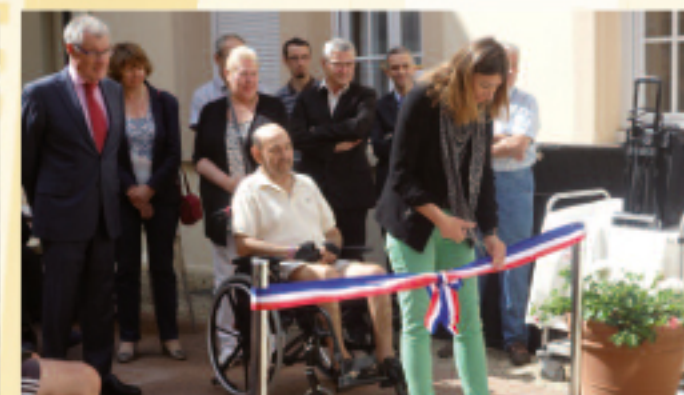
23 JUIN • Inauguration d'un boulo-drome à l'Hôpital en présence du Maire, des élus de Chevreuse, des sociétaires du Crédit Agricole et des agents de l'établissement.