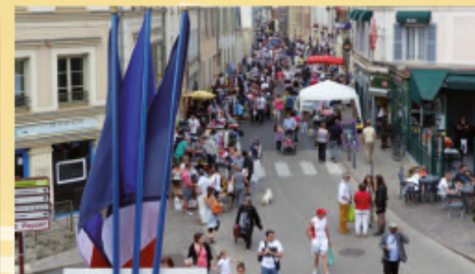
14 JUIN • Retour réussi du Vide-greniers en centre-ville de Chevreuse (voir reportage p. 8).