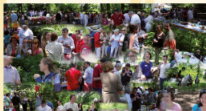
21 MAI • Fête des voisins organisée dans différents quartiers et résidences de Chevreuse (voir reportage p. 7).