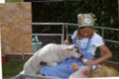
3 JUIN • La résidence l'Ermittage du groupe Domusvi à Chevreuse a fêté son festival