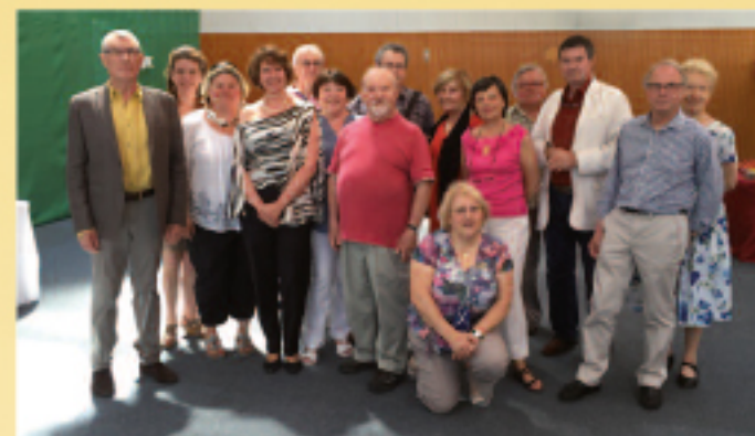
6 & 7 JUIN • Exposition des travaux de l'ARC à l'Espace Fernand Léger (voir reportage p. 14).