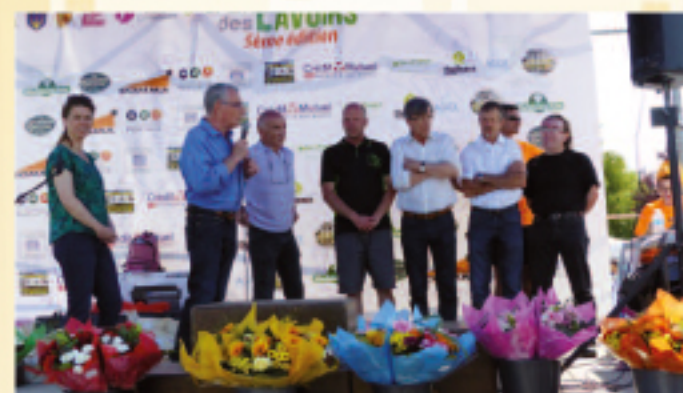
7 JUIN • Remise des prix à l'issue de la 5 e édition du Trail des Lavoirs (voir reportage p. 13).