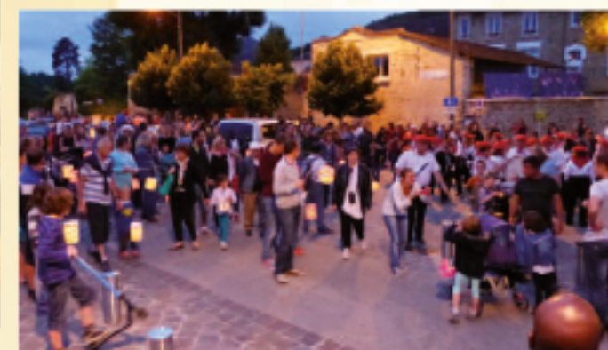
20 JUIN • Feux de la St-Jean et balade aux lampions dans les rues de Chevreuse (voir reportage p. 8).