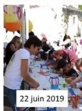
Les lampions pour la fête de la St Jean

Plus une dotation aux écoles en fin d'année pour acheter des jeux pour VOS enfants